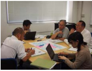
レポート発表／討議の様子